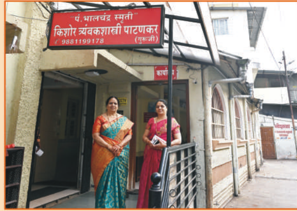
బాల చంద్ర స్మృతి